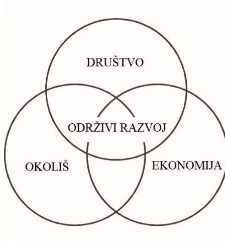
Slika 1. Koncept održivog razvoja

Agenda 2030 temelji se na Opštoj deklaraciji o ljudskim pravima, međunarodnim ugovorima o ljudskim pravima i naglašava odgovornosti svih država da poštuju, štite i promoviraju ljudska prava. Agenda 2030 jasno dovodi u vezu zaštitu okoliša sa temeljnim ljudskim pravima, a sve u kontekst održivog razvoja, čiji se primarni ekonomsko-okolišni fokus proširuje i dobija opšte-društveni smisao, razvoj društva u svim segmentima. Agenda promovira 17 osnovnih i 169 specifičnih cilja u polju unapređenja mira, pravde, ljudskih prava, socio-ekonomskog statusa ljudi, zaštite okoliša (UNDP, 2020).